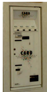
プリペイドカード 自動販売機 (別途)