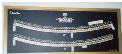
フロント打席表示盤