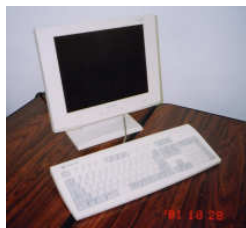
打席管理コンピュータ