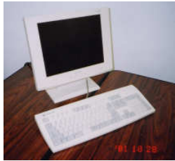
打席管理コンピュータ