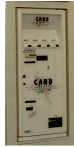
プライベートカード 自動販売機 (別途)